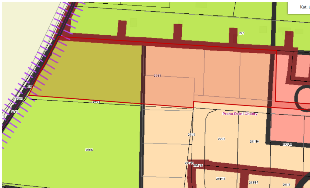
Výřez z hlavního výkresu grafické části Územního plánu

Podle žádosti má dojít k umístění účelové komunikace na nově vzniklém pozemku parc. č. 294/3-B v k. ú. Dolní Chabry. Funkční využití této plochy dle územního plánu hl. m. Prahy („Územní plán“) je určeno jako plocha pro sady, zahrady a vinice (PS).