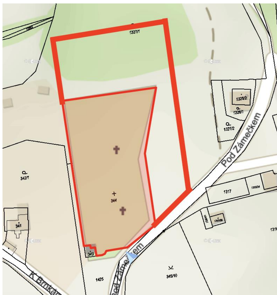
Obr. 1: Vyznačení obvodu změny v katastru nemovitostí

Požadovaná změna ÚP spočívá ve změně funkčního uspořádání území z plochy s rozdílným způsobem využití LR na plochu s rozdílným způsobem využití ZP.