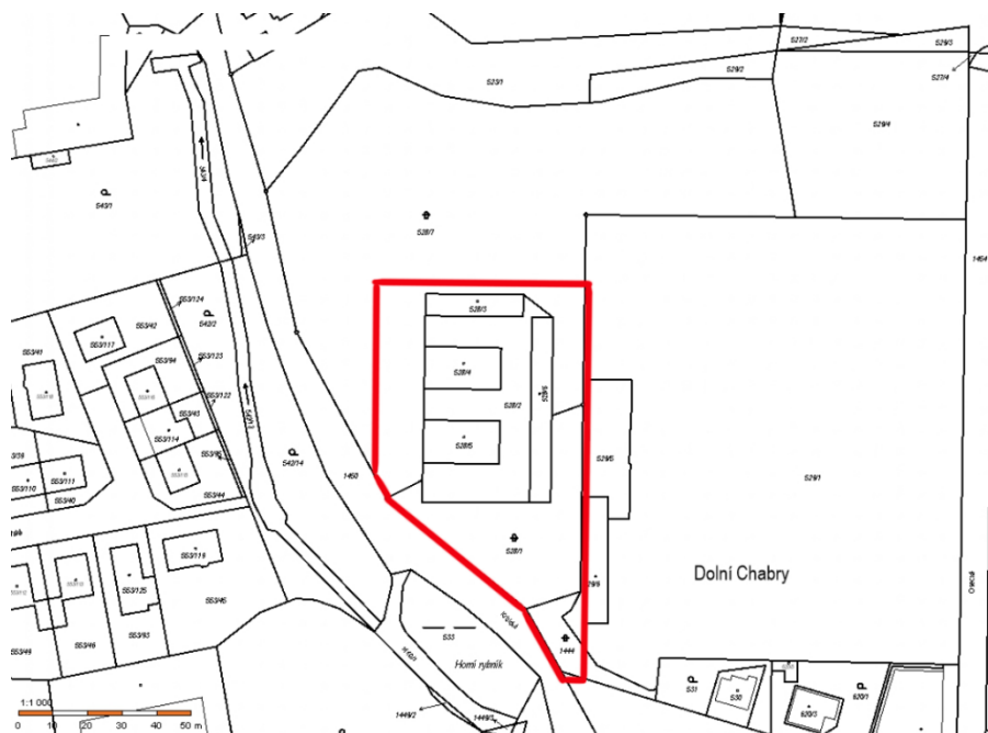
Obr. 1: Vyznačení obvodu změny v katastru nemovitostí

Požadovaná změna spočívá ve změně plochy VV a části plochy ZMK na plochy sportovišť SP.