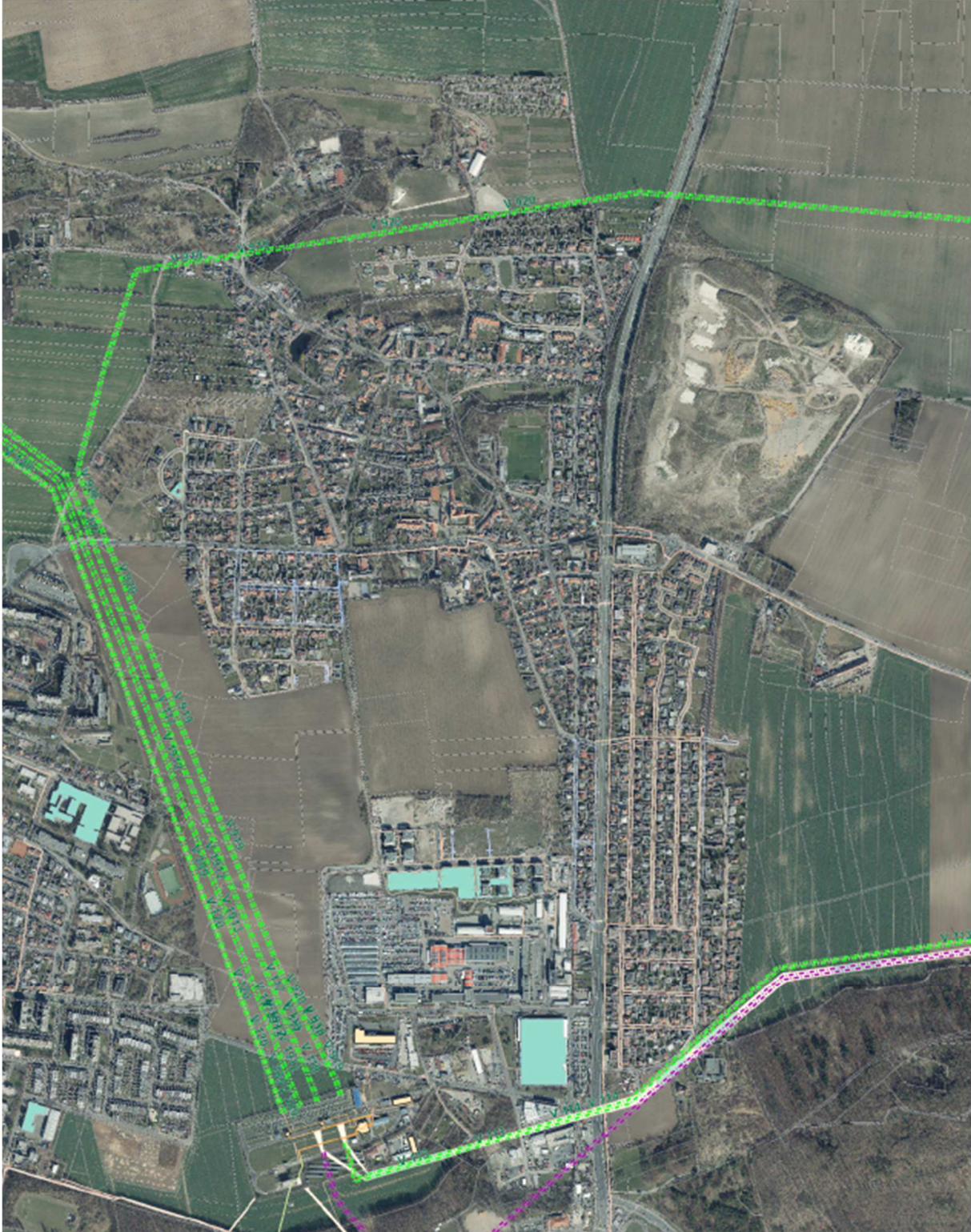
Dolní Chabry a sítě 110 kV – stávající stav, nižší detail