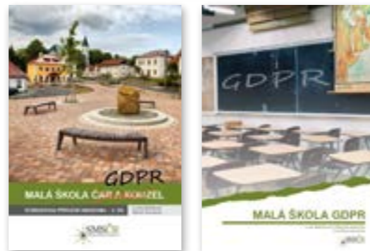
příruční knihovna pro starosty obcí a ředitele škol