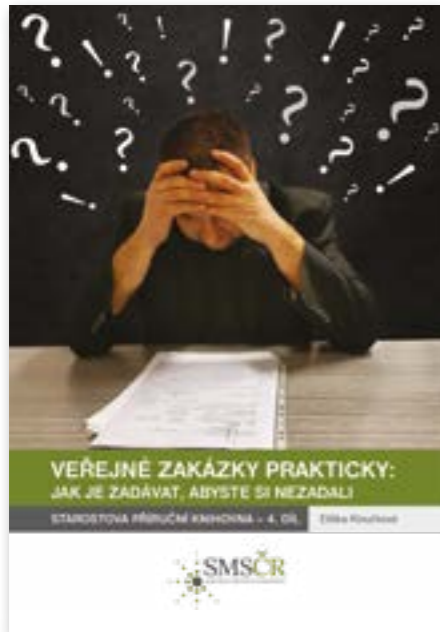
publikace k zadávání veřejných zakázek malého rozsahu obsahující vzorové dokumenty