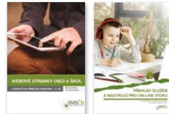
příruční knihovna pro starosty obcí a ředitele škol