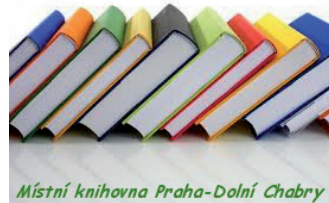
Místní knihovna Praha-Dolní Chabry

Chaberský dvůr chystá pro Vás, naše Chaberáky, vánoční výstavu v Galerii Chaberského dvora. Obsah výstavy neprozradíme, ale Ti z Vás, kteří se chtějí na výstavě podílet, prosíme o přinesení vzorků cukroví do kulturního centra Chaberského Dvora. Pomůžete nám tak pro ostatní zdokumentovat voňavou tradici „Jak se peče v Chabrech“. Děkujeme.