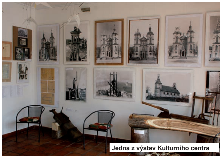
Jedna z výstav Kulturního centra