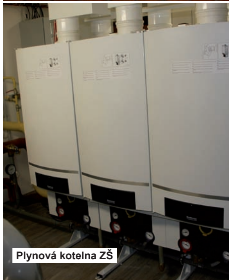
Plynová kotelna ZŠ