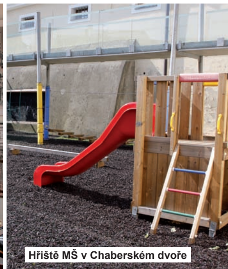
Hřiště MŠ v Chaberském dvoře