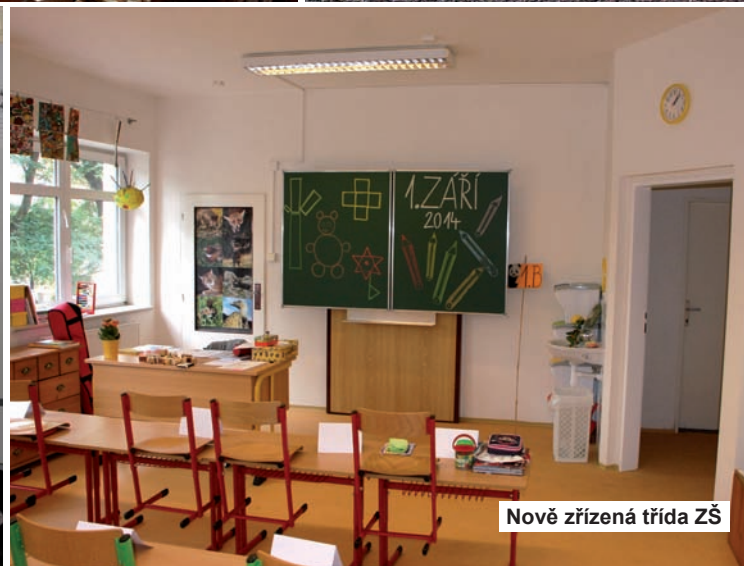
Nově zřízená třída ZŠ