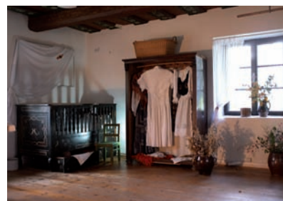
Pořádá: Občanské sdružení na ochranu památek v Dolních Chabrech z. s.