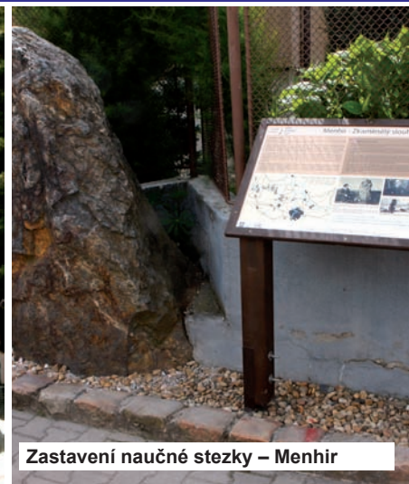
Zastavení naučné stezky – Menhir