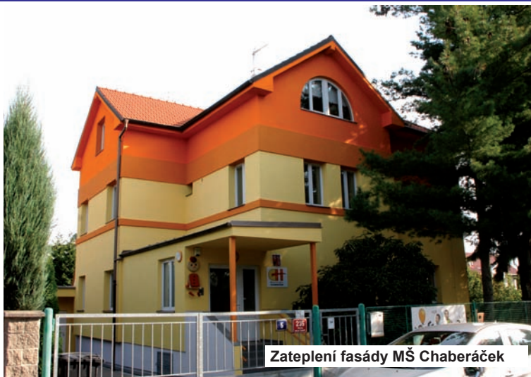
Zateplení fasády MŠ Chaberaček