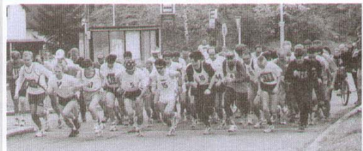
Aktí celostátního významu byl šestý ročník běhu o Velkou cenu Gustava Peši, který se konal 20 dubna.