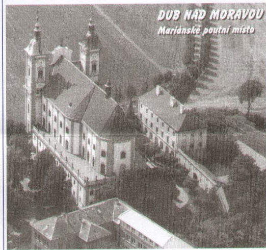
DUB NAD MORAVOU Mariánské poutní místo

Další výlet plánujeme na září a bude směřovat na Šumavu, tak jak si mnozí ze seniorů přáli a zapsali svá přání do anketních listků.